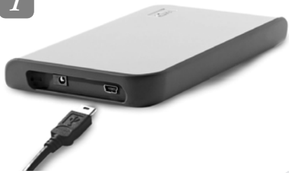
Connect the USB cable to the drive