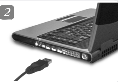
Connect the USB cable to the computer